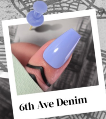
6th Ave Denim