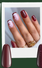
NUTCRACKER RED SoPRO 77