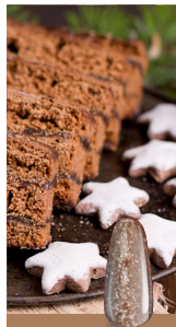
GINGERBREAD WISH Flexy 200

Un tono ciruela con brillo, como un dulce cuento de hadas del País de los Dulces – encantador y sensual.