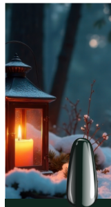
YULETIDE FOREST Flexy 152

Verde esmeralda, como las ramas del árbol de Navidad – fresco, intenso y lleno de vida.