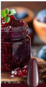
SUGARPLUM FAIRY maniMORE 66

Un rojo profundo inspirado en el ballet El Cascanueces – elegante, audaz y atemporal.