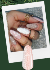
MARZIPAN GLOW SoPRO 68