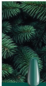
MERRY FIR maniMORE 28

Purpurina dorada que recuerda los adornos en las galletas de jengibre – cálida, alegre y mágica.