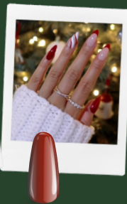
CANDY APPLE maniMORE 89