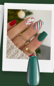
MERRY FIR maniMORE 28