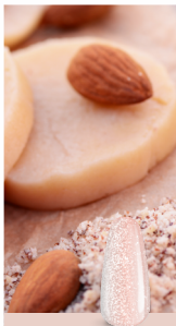
MARZIPAN GLOW SoPRO 68

Un rosa sutil con microbrillos, como el glaseado de las galletas navideñas – dulce, delicado y encantador.