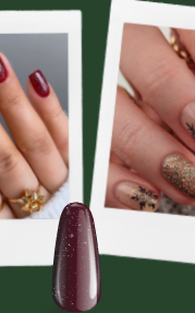
SUGARPLUM FAIRY maniMORE 66