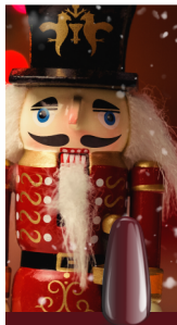
NUTCRACKER RED SoPRO 77

Un rojo intenso, como manzanas bañadas en caramelo en un mercado navideño – un clásico lleno de energía